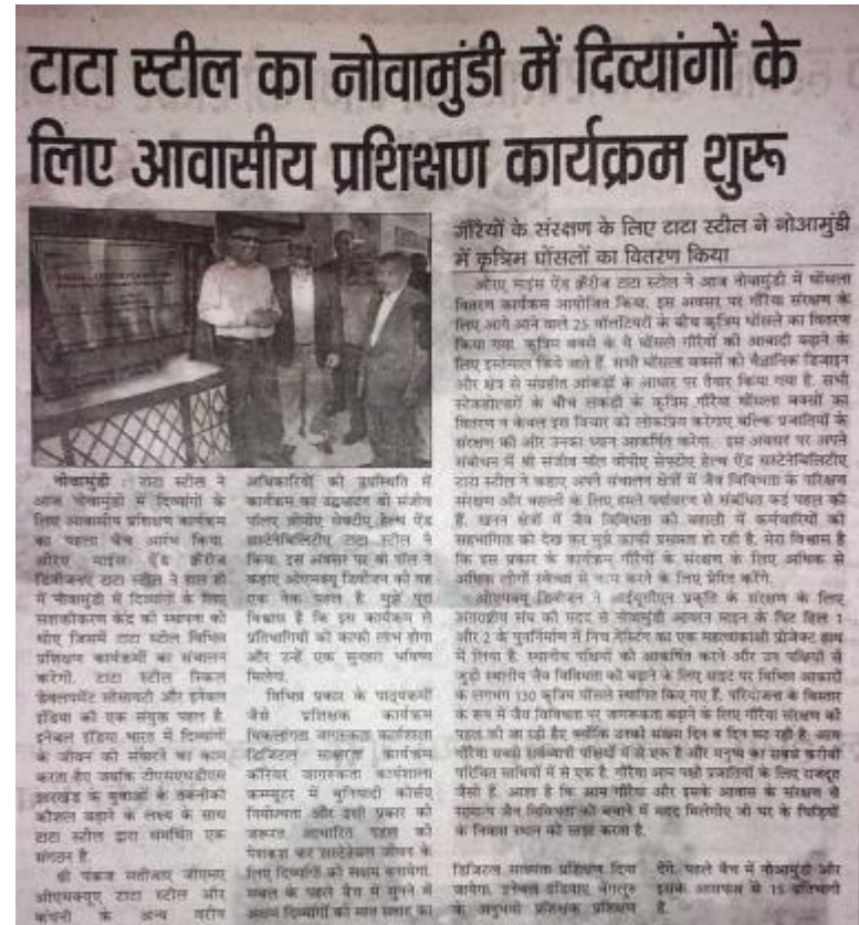
New Ispat Mail Dec 21, 2017