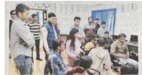
नोवामुंडी में दिव्यांगों के कंप्यूटर कक्ष का निरीक्षण करते प्रशिक्षु आईएस।