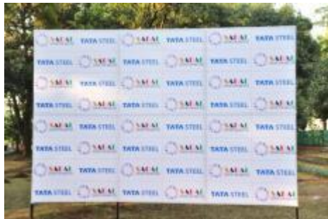
Backdrop [ Inauguration ]