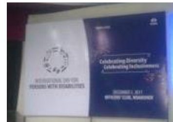
Cultural night backdrop