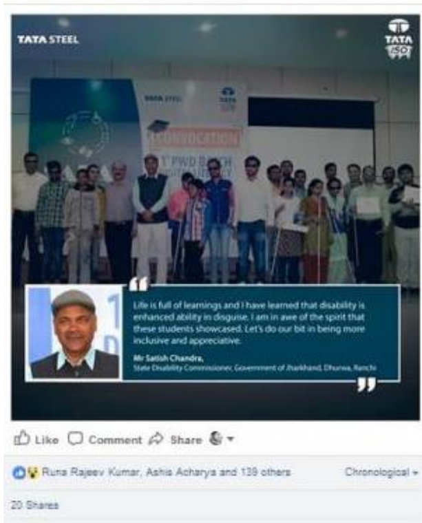
Facebook post on the convocation ceremony.

Electronic media team from popular news network covered SABAL inauguration in prime time slot.