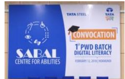
Backdrop [ Convocation ]