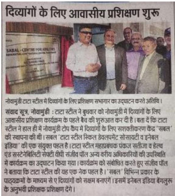
Dainik Jagran Dec 21, 2017