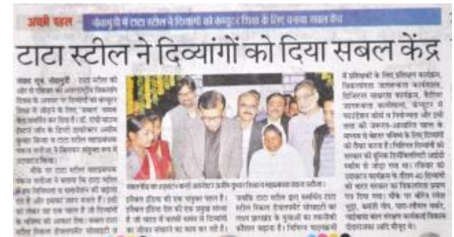
Dainik Jagran Dec 4, 2017