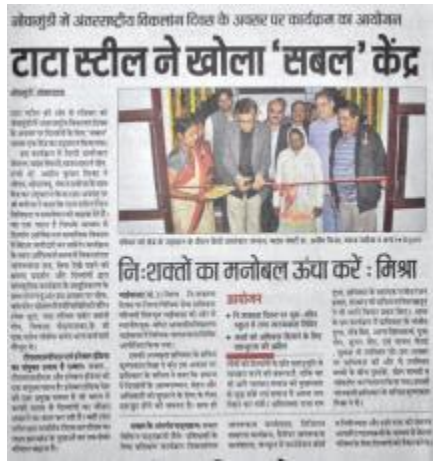
Hindustan Dec 4, 2017