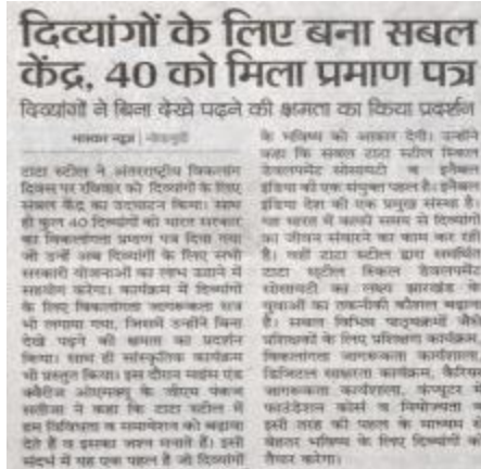
Dainik Bhaskar Dec 4, 2017