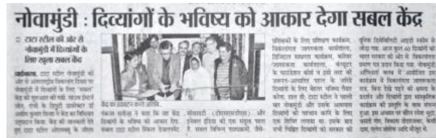
Prabhat Khabar Dec 4, 2017