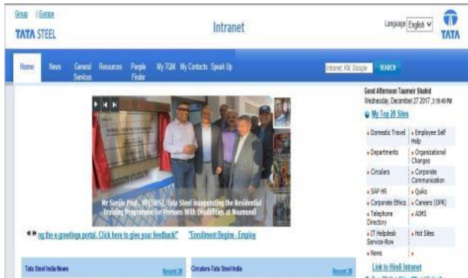
Intranet Flash Upload – Inauguration