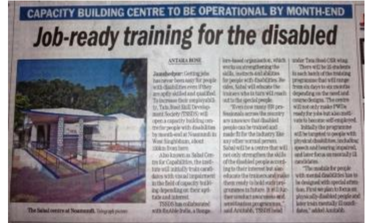
The Telegraph Dec 12, 2017