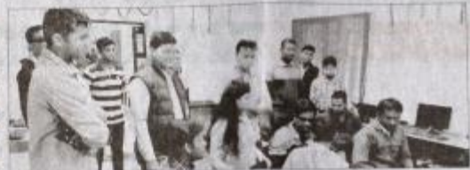
सबल केंद्र का अत्यंतोत्कर्ष करती टीम।