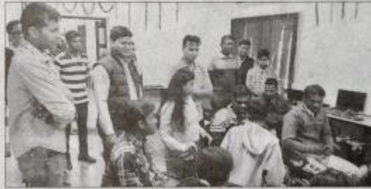
टाटा स्टील की ओर से दिव्यांगों के लिए चल रहे सबल प्रशिक्षण केंद्र में प्रशिक्षु आईएस की टीम।